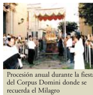
Procesión anual durante la fiesta del Corpus Domini donde se recuerda el Milagro