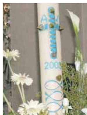
Cirio conmemorativo con los pescados de Alboraya-Almácer