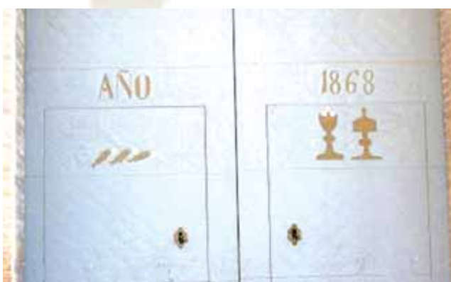
Los peces del Milagro están representados en la puerta de ingreso de la ciudad