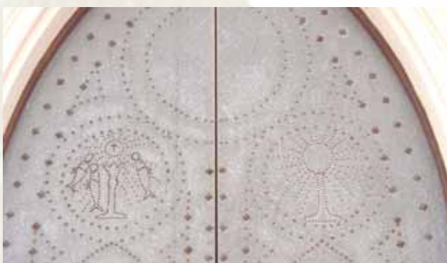
Detalle del portón de ingreso de la iglesia construida en memoria del Milagro