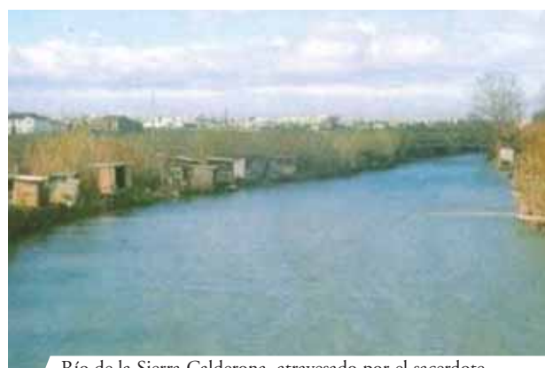
Río de la Sierra Calderona, atravesado por el sacerdote