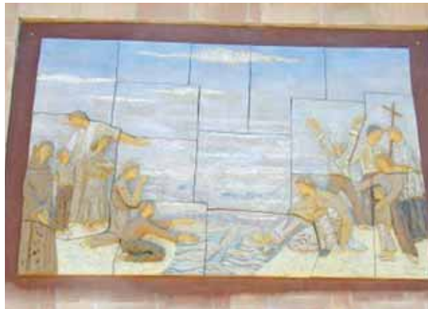
Representación del Milagro