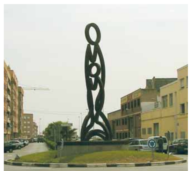
Escultura conmemorativa del Milagro en el centro de la ciudad