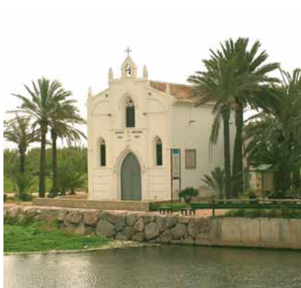
Iglesia – ermita de Alboraya