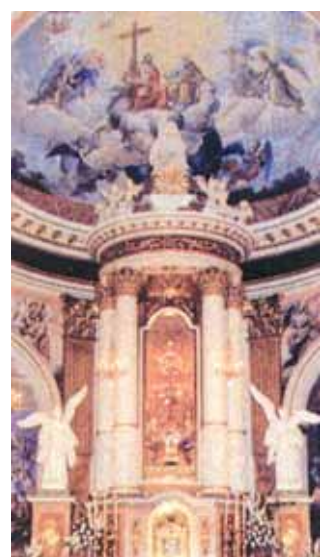
Interior de la parroquia de Almácer