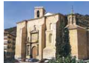
Basilica de Santa María