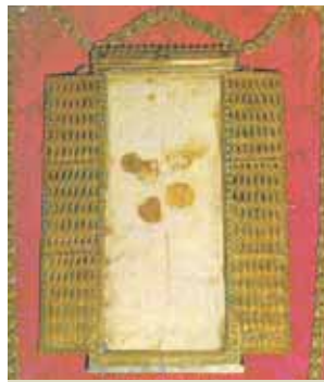
Reliquia de uno de los dos Corporales manchados de Sangre. Se conservan en la iglesia de Daroca

El Milagro Eucarístico de Daroca se verificó poco antes de una de las numerosas batallas sostenidas por los españoles contra los moros. Los comandantes cristianos pidieron al sacerdote celebrar una Misa, pero pocos minutos después de la consagración un ataque sorpresa del enemigo obligó al sacerdote suspenderla y esconder las Hostias consagradas dentro de un paño. La victoria estuvo a favor de los españoles. Entonces, los comandantes pidieron al sacerdote poder comulgar con las Hostias que se habían consagrado pero estas fueron encontradas completamente recubiertas de Sangre. Actualmente es posible venerar el paño teñido de Sangre.