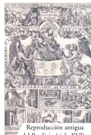
Reproducción antigua del Prodigio (siglo XVI)