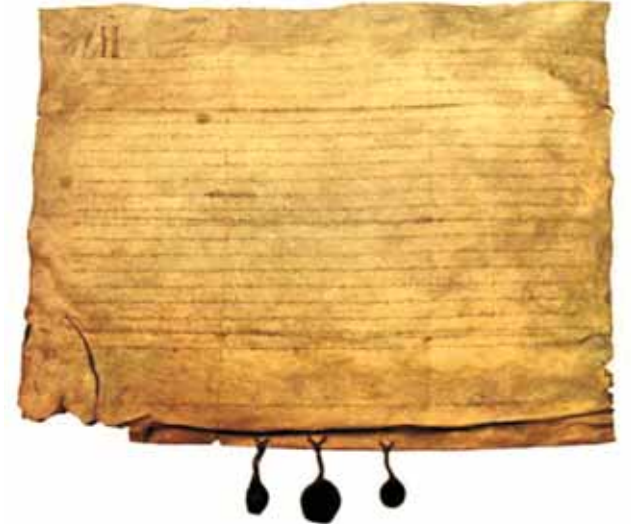
Carta de Chiva, pergamino con la descripción del Prodigio, conservado en la iglesia colegial