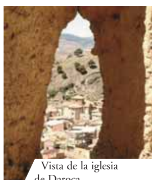
Vista de la iglesia de Daroca