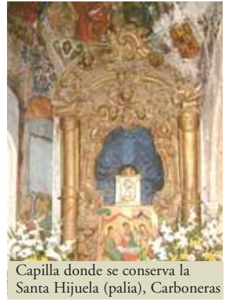
Capilla donde se conserva la Santa Hijueta (pala), Carboneras