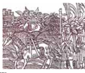
Grabados antiguos del Milagro