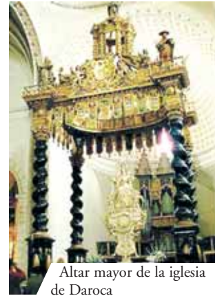
Altar mayor de la iglesia de Daroca