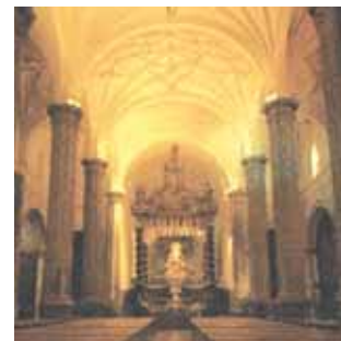
Interior de la iglesia