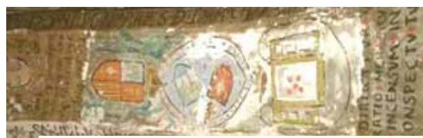
Frescos de la Capilla de la Santa Hijuela, Carboneras