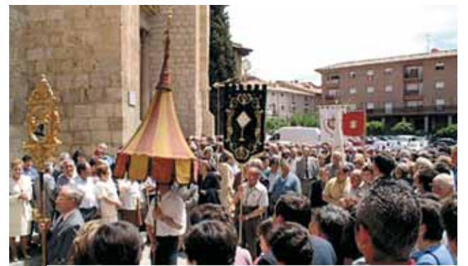
Procesión anual en honor al Milagro de Daroca