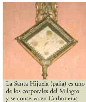
La Santa Hijuela (palia) es uno de los corporales del Milagro y se conserva en Carboneras