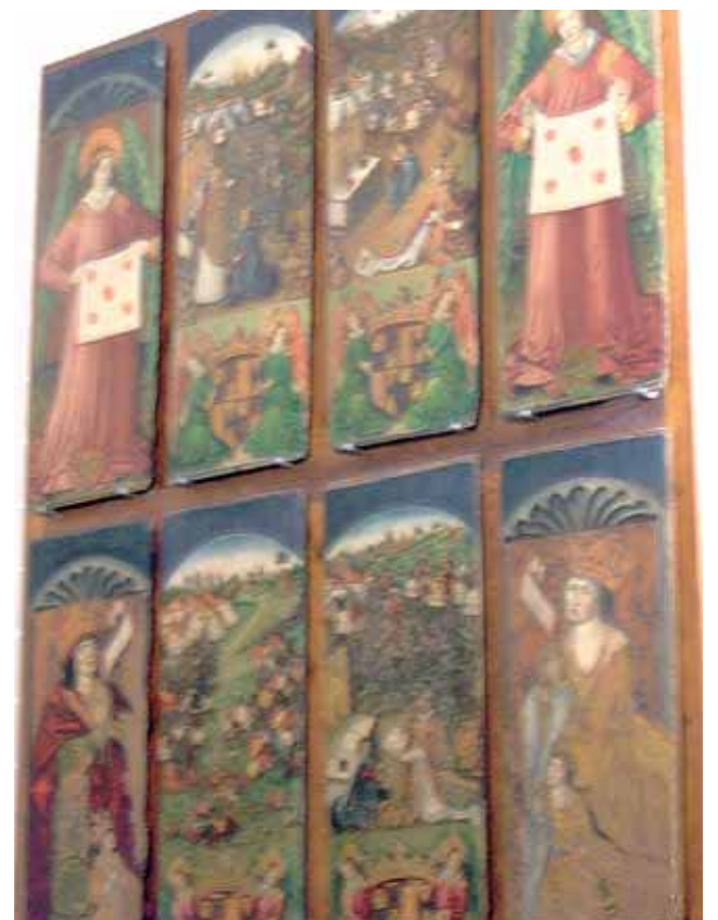
Pinturas murales presentes en la capilla de Los Corporales con la descripción del Milagro