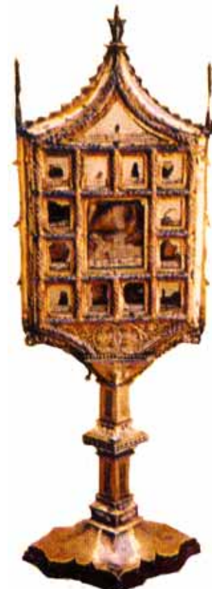
Custodia con la Reliquia del Prodigio