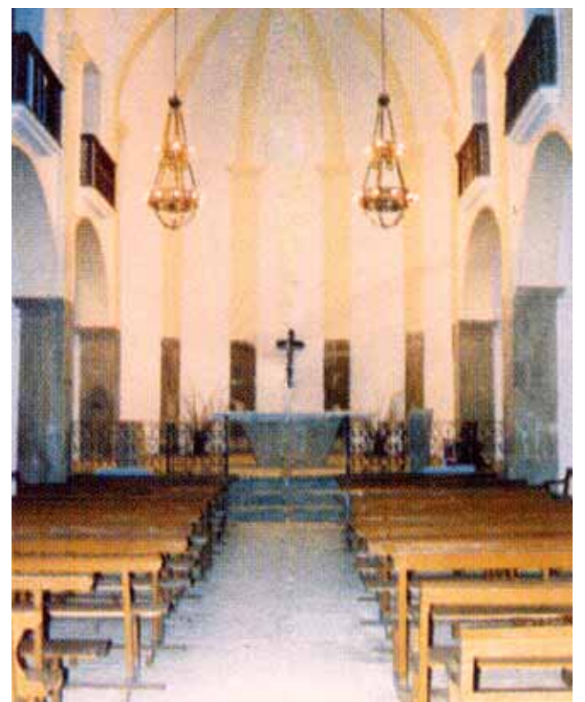
Interior del Santuario