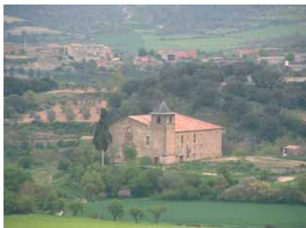
Santuario donde sucedió el Milagro

Detalle de una de las pinturas presentes en el interior del Santuario. Representa las escenas del vino derramado que se transforma en Sangre