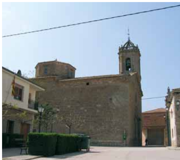
Iglesia de San Cugat, donde se custodian las Reliquias del Milagro