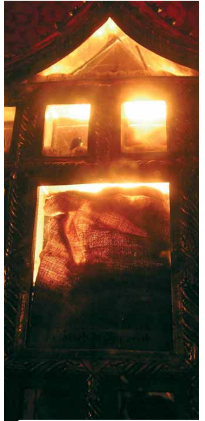
Detalle de la custodia que contiene las Sagradas Reliquias