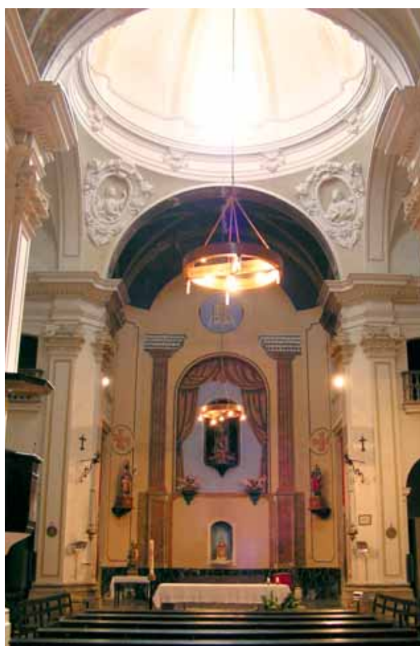
Interior de la iglesia de San Cugat