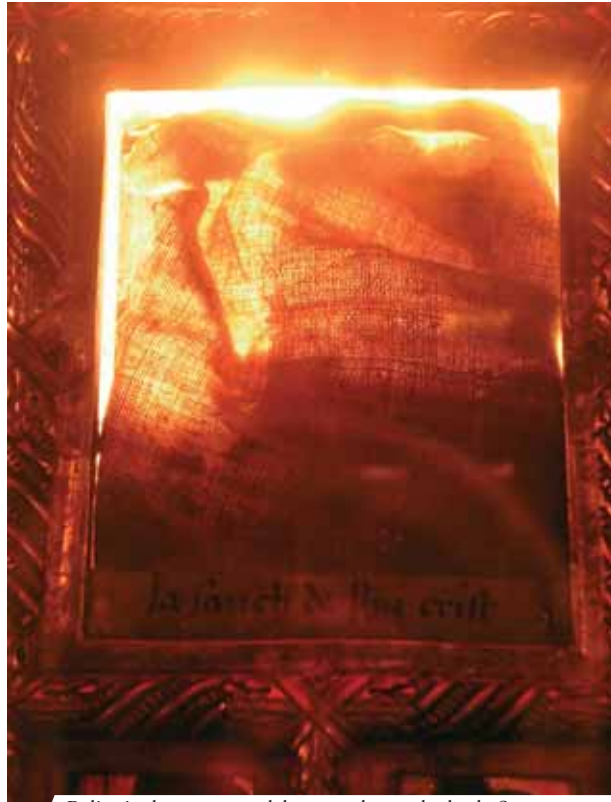
Reliquia de una parte del corporal manchado de Sangre

El vino en el cáliz se convirtió en Sangre y se derramó sobre el mantel de altar, cayendo hasta el piso.